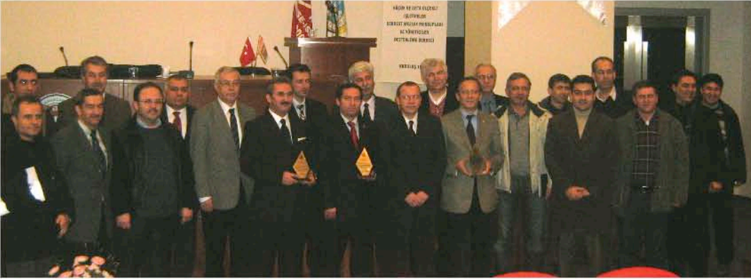
Seminer sonunda katılımcılara teşekkür plaketi verildi.

TOSYÖV Bursa Destekleme Derneği ve Karacabey Ticaret ve Sanayi Odası'nın birlikte düzenlediği eğitim seminerleri Karacabey'de gerçekleştirildi.