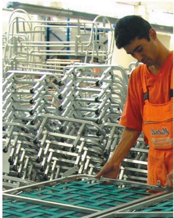
Mobilya sektörünün önde gelen markalarından Seray, 2008'de de yatırımlarını sürdürecektir.